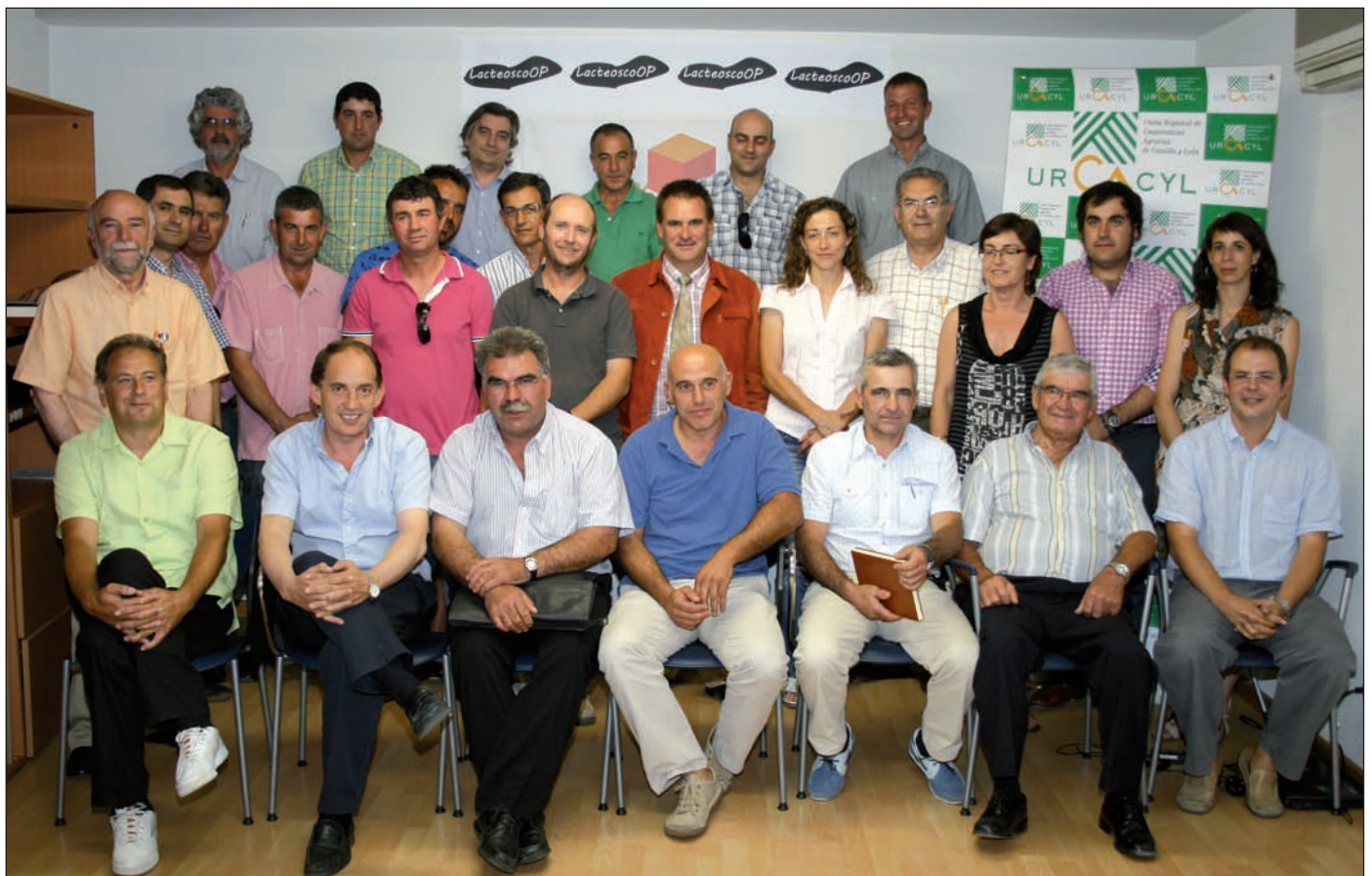
Representantes de las trece cooperativas integradas en Lacteoscoop.

Impulsada por Urcacyl y constituida por doce cooperativas de Castilla y León y una de Cataluña, está abierta a nuevas incorporaciones