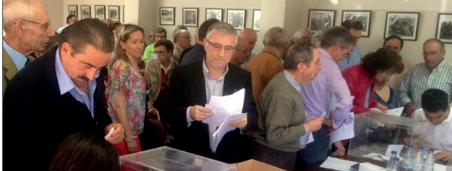
Votación de socios para aprobar la fusión de Macotera y San Isidro.