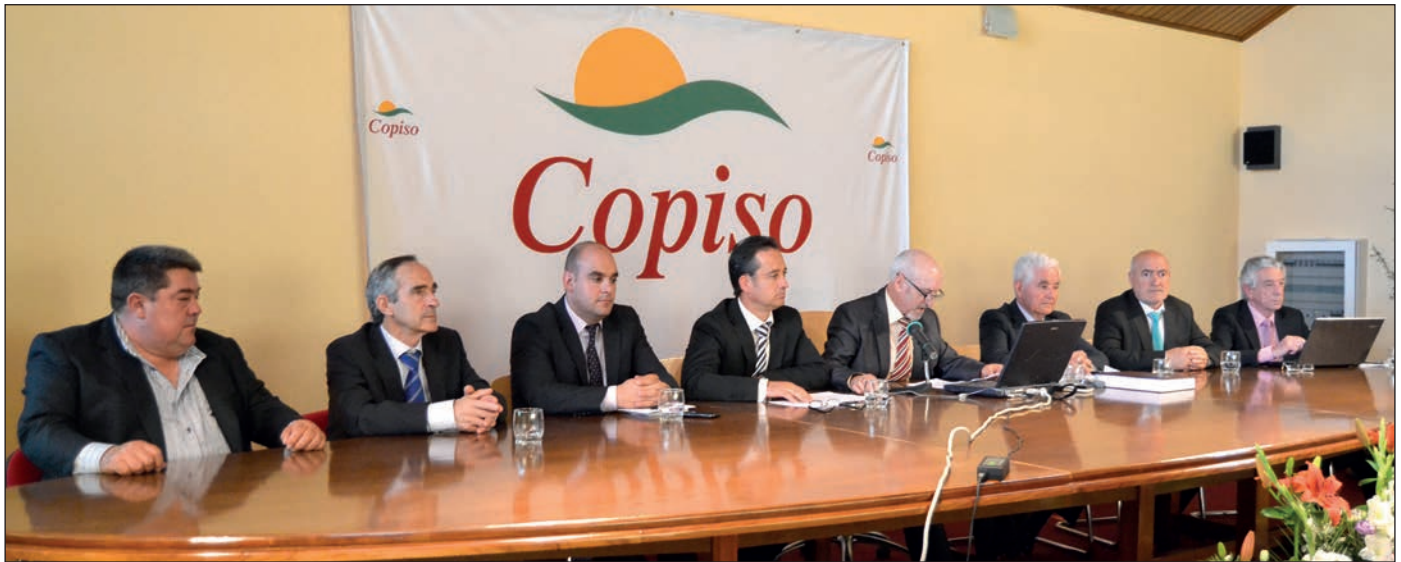
Consejo Rector de Copiso.

clave de su modelo está en que "la producción agrícola y la ganadera van de la mano" . A su juicio, "las dos actividades se complementan y se benefician mutuamente gracias a un modelo cooperativo integrador que han forjado los socios, conseguido después de años de trabajo, de esfuerzo y de implicación del campo soriano" .