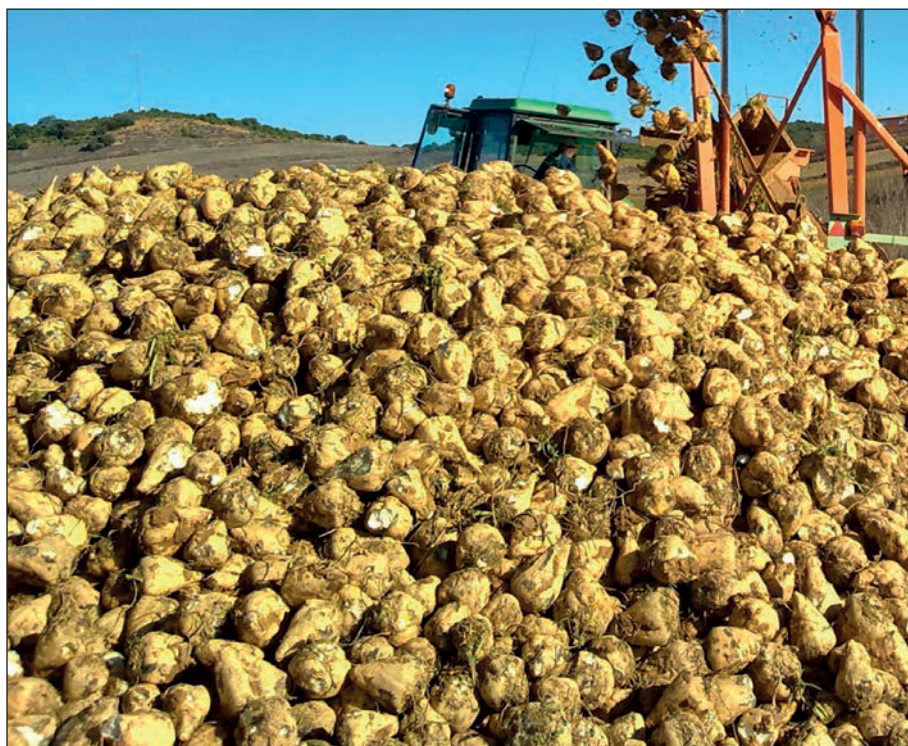
Acor solicita que el importe de la ayuda aplicable a la remolacha azucarera, consistente en una prima por hectárea de superficie cultivada de regadío, alcance el límite máximo anual de 600 euros por hectárea.

La desaparición del cupo histórico o cuota productiva individual, con la liberalización del precio mínimo de contratación que lleva aparejada, puede suponer que ciertos productores de remolacha se vean obligados a abandonar a partir del 2017 el cultivo,