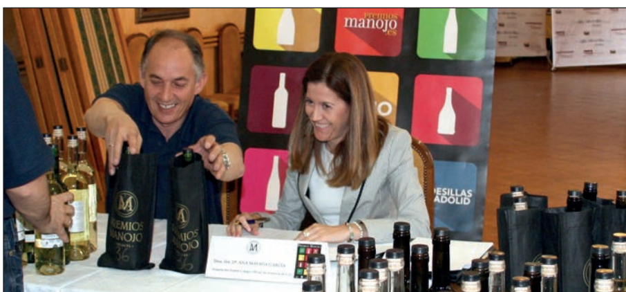
Arriba, catadores de los Premios Manojó. Abajo, la notaria de Tordesillas durante el ensacado de los vinos presentados al certamen.

También se contacta con los participantes del Comité de Cata para informarles de las bases y de las fechas y para reservarles habitaciones durante los días que estén catando.