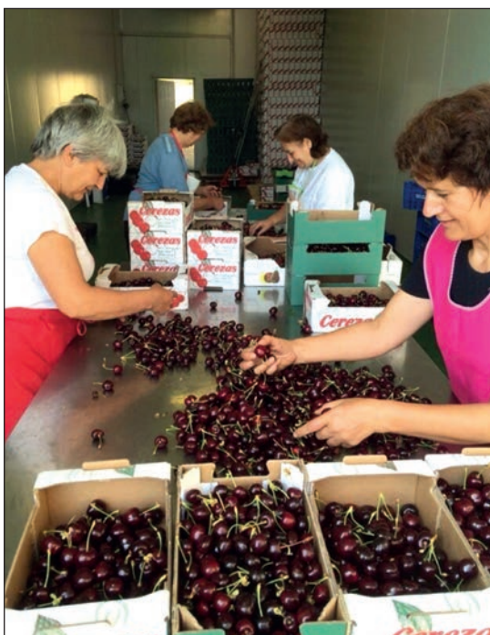
De izquierda a derecha, cerezas a punto de ser recolectadas y trabajadoras de la Cooperativa Romero procesando la fruta.

L a Cooperativa Romero, de carácter familiar, se encuentra en la Sierra de Salamanca, en el municipio de Sotoserrano. Su especialización es el cultivo del cerezo, del que tienen cerca de 20 hectáreas dispuestas de forma abancalada. En todas sus parcelas está establecido el riego por goteo, que se suministra en unos casos de perforaciones y en otros de agua elevada desde el río.