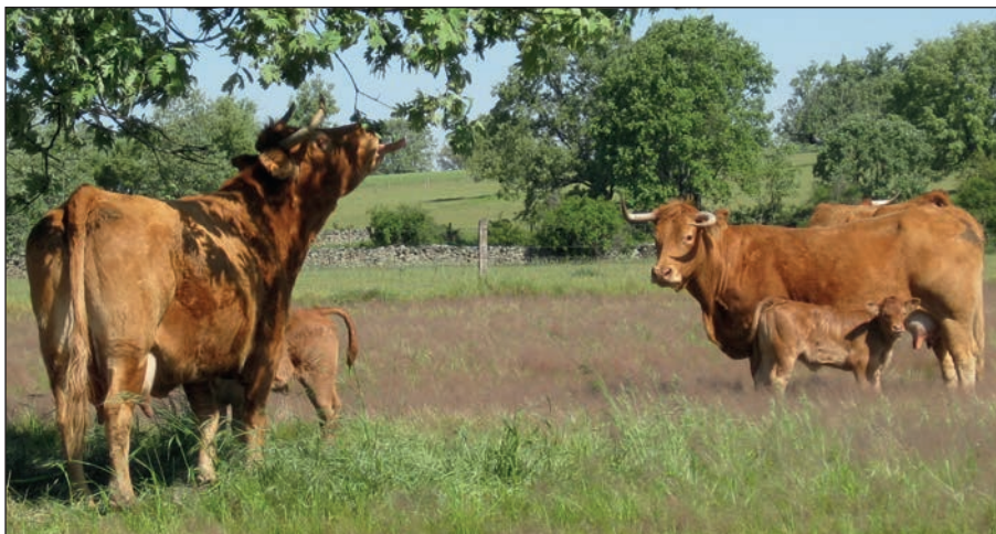
Castilla y León es la comunidad autónoma que más censo de vacuno tiene con 1,214 millones de cabezas, lo que supone un 20,76% del total nacional.

En el apartado de los sectores estratégicos, es decir aquellos que tendrán prioridad a la hora de beneficiarse de apoyos, se ha solicitado que se incorpore al vacuno de carne, por el peso que supone a nivel nacional y por su importancia social, económica y medioambiental. De hecho, Castilla y León es la comunidad autónoma que