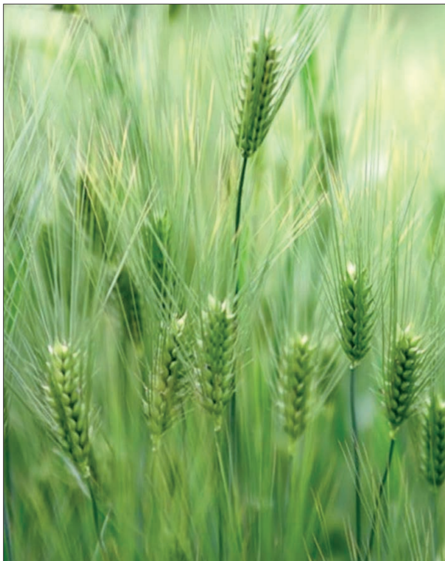
Las observaciones realizadas por Urcacyl al futuro PDR son fruto de la recopilación de las realizadas por el conjunto de cooperativas agrarias de Castilla y León en temas sectoriales

Las observaciones realizadas por Urcacyl al futuro PDR son fruto de la recopilación de las realizadas por el conjunto de cooperativas agrarias de Castilla y León en temas sectoriales, como el ovino, la remolacha o la apicultura, y por tanto se trata de un