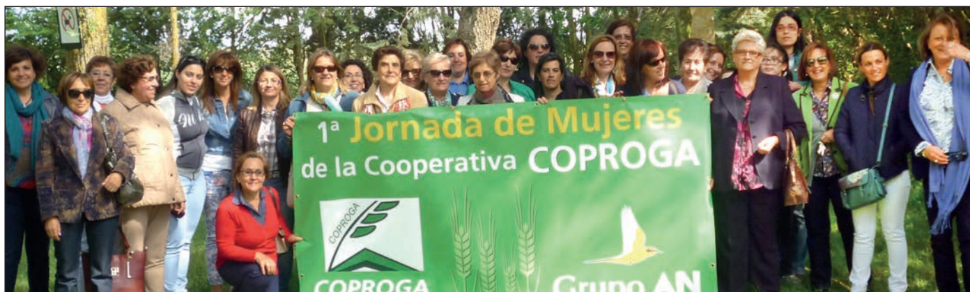
Participantes en la I Jornada de Mujeres organizada por Coproga.

Con el objetivo de que las familiares de los socios conozcan la empresa social de Medina de Rioseco