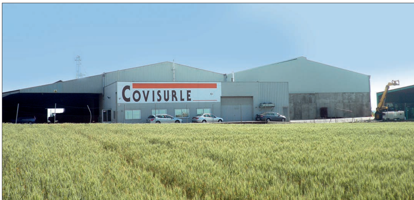
Instalaciones de Covisurle, ubicadas en Valencia de Don Juan (León).

La cooperativa leonesa cuenta con 73 ganaderías asociadas