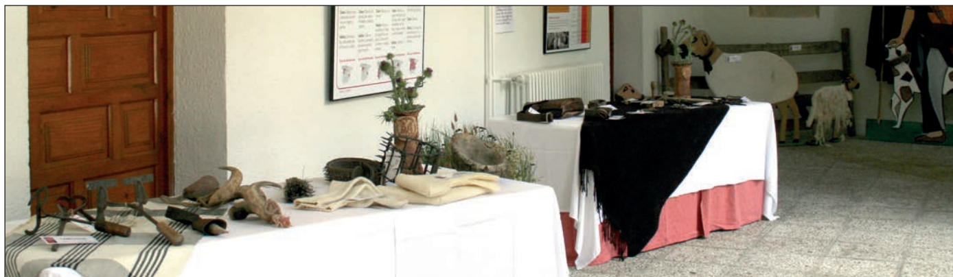
La exposición cuenta con más de 100 piezas.

Asovino nació en 1989, como iniciativa de un grupo de ganaderos de ovino de leche que hacían la comercialización conjunta y que decidieron constituir una cooperativa. Recientemente ha sido acreedora del premio a la mejor empresa cooperativa 2013, otorgado por la Consejería de Economía y Empleo de la Junta de Castilla y León. Además, presta a las explotaciones de sus ganaderos todo tipo de servicios y asesoramiento, velando por la permanencia de un sector vital para el desarrollo de los pueblos y para la economía de las explotaciones ganaderas.