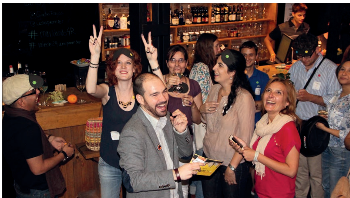
Blogueros participantes en el evento 'Maridando por el mundo con Cuatro Rayas' organizado en Madrid.

30 bloggers participan en una iniciativa de la bodega cooperativa donde se maridan sus vinos con la gastronomía de seis países