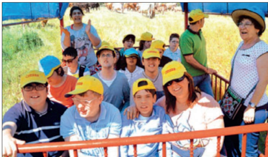
Alumnos de El Camino de Aspace.