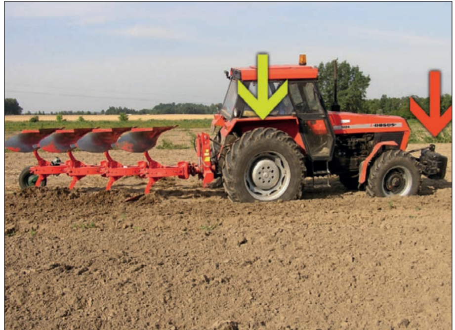
Gráfico con la posición de los contrapesos.