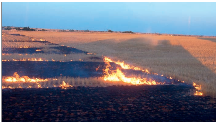
La quema de los rastrojos, de forma controlada y rotativa en las explotaciones, puede facilitar el control de las malas hierbas y enfermedades de forma más efectiva, económica y e incluso beneficiosa para el medio ambiente.

Este es el caso de las crecientes infestaciones de bromo o vallico , que se hacen resistentes por el uso continuado de herbicidas; plagas como zabrus tenebroides y troncha espigas o del género calamobius y trachelus , que evitarían el empleo de insecticidas de