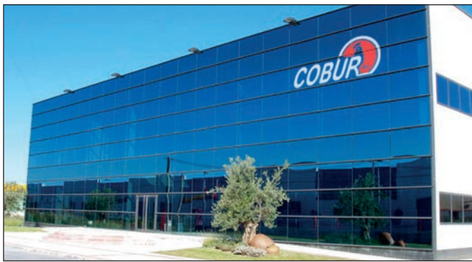
Sede de la Cooperativa Avícola y Ganadera de Burgos.

Su objetivo para 2014 es incrementar un 3% de media su producción en todas las áreas de actividad