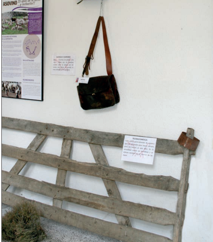
A la izquierda, esquilas y cencerros; arriba, morrales y teleras.