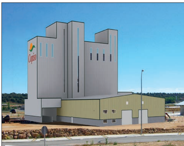
Recreación de la nueva fábrica piensos de Copiso.

Las ventas de la cooperativa alcanzaron 157,6 millones de euros en 2013, un 3,69% menos que el ejercicio anterior debido, sobre todo, al descenso del precio de las materias primas agrícolas y a la baja cosecha de la campaña 2012-13. Las previsiones para 2014 apuntan a un incremento de facturación cercano al 8%, aun-