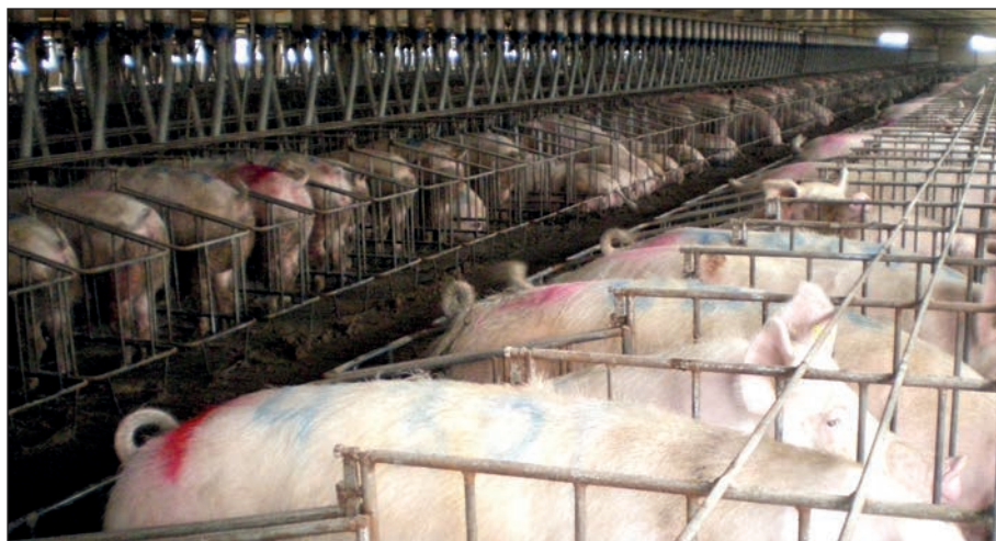
El proyecto Legumpor persigue disminuir la dependencia de importación de proteína vegetal extranjera, en especial de la soja, para sustituirla por el cultivo de proteaginosas autóctonas para la alimentación del ganado porcino.

Interesantes conclusiones como colofón a una magnífica labor de tres años, de intenso trabajo, pero también de gratificante colaboración y trabajo en equipo, que pronto tendrán su reflejo en nuevas estrategias de producción y beneficios económicos para la cooperativa, que ya desde hoy ha comenzado a pensar en nuevas ideas y nuevos proyectos de I+D.