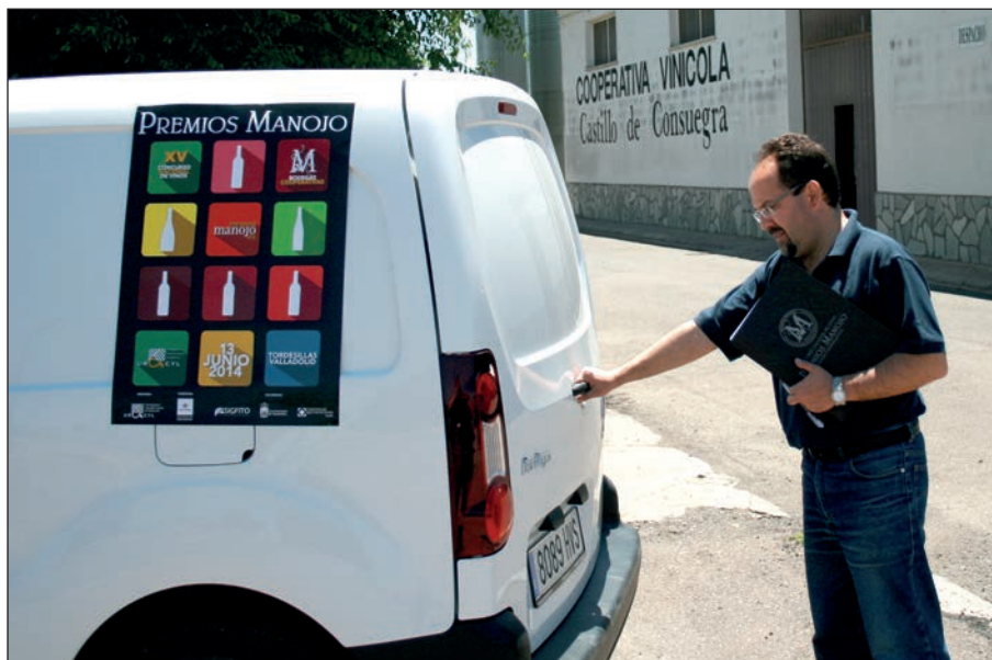
Recogida de botellas en una de las bodegas que se presentó a los Premios Manajo.

La cata se realiza en silencio y con gran concentración, velando el presidente del Comité que así sea. Durante los días en que se celebran las catas la relación entre los miembros del jurado es muy intensa y se desarrollan, al finalizar las mismas, actividades lúdicas y sociales en la que se crean enormes lazos de amistad y compañerismo entre