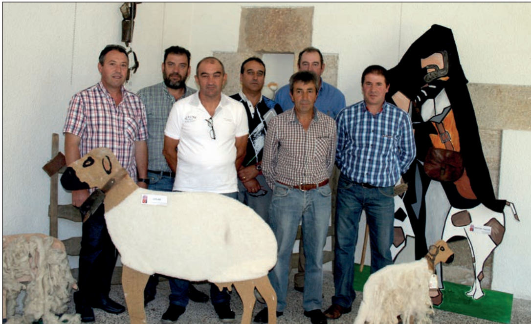
Consejo rector de Asovino en la exposición organizada por la cooperativa zamorana con motivo de su 25 aniversario.