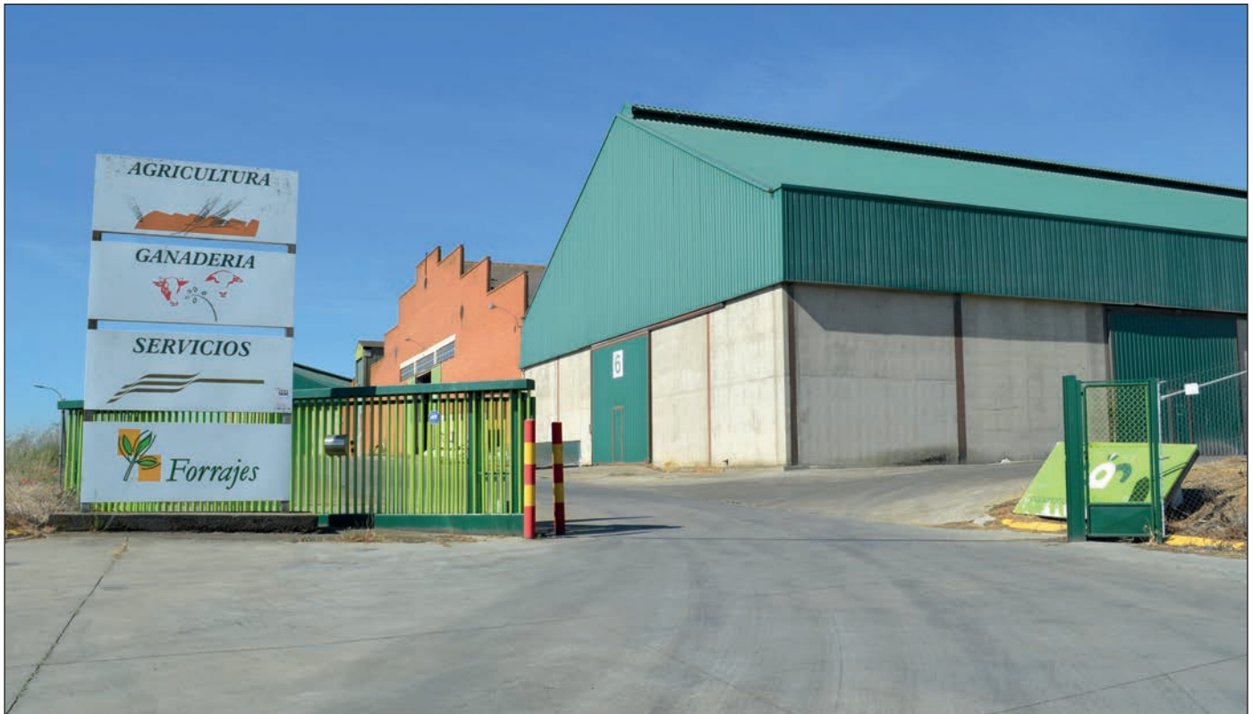
Instalaciones de Cooperativa Agrícola Regional en Carrión de los Condes (Palencia).