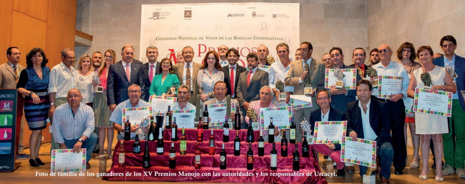
Foto de familia de los ganadores de los XV Premios Manajo con las autoridades y los responsables de Urcacyl.