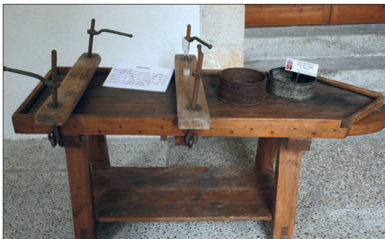
Arriba, tablas y prensa para la elaboración de quesos. En el centro, rueca, capa alistana y objetos de lana. Abajo, tijeras y útiles de esquila.