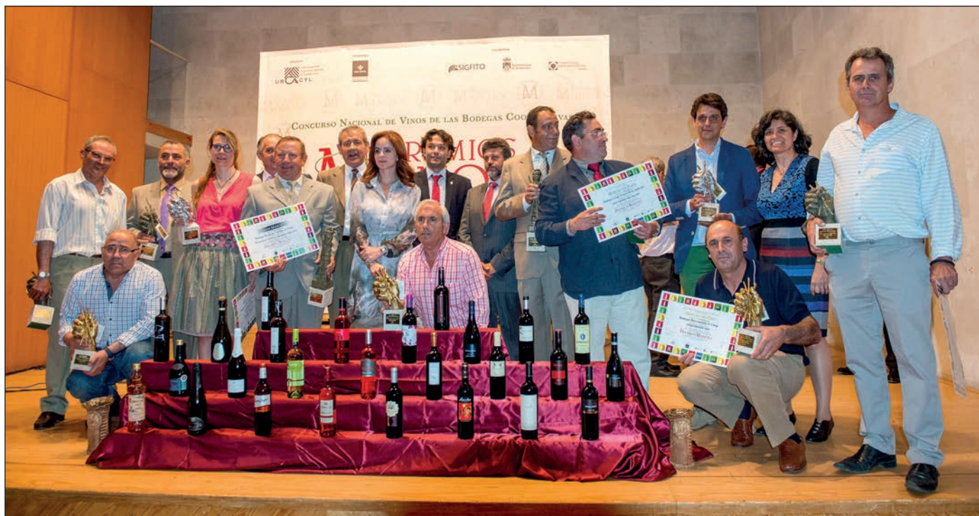
Representantes de las bodegas cooperativas de Castilla y León premiadas en los Manajo.

recordó que, desde 2009, estas sociedades han destinado tres millones de euros a este área, con una subvención de 1,55 millones.