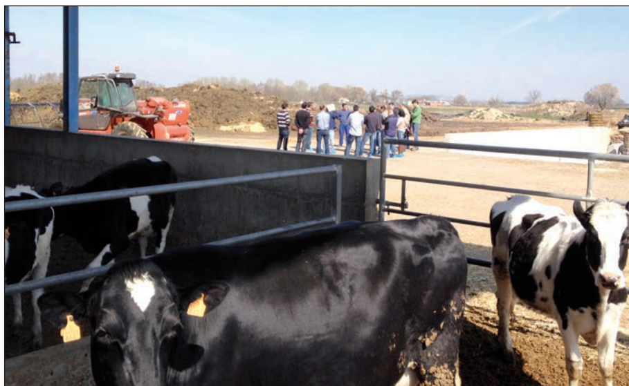
Asistentes al curso en la sesión práctica en una explotación del municipio de Pollos (Valladolid).

Por cierto, el asesor de explotaciones respondería a las cuestiones del inicio del artículo lo siguiente: en cuanto a los estercoleros, tanques o fosas de estiércol y purín serán obligatorias para las estabulaciones permanentes o semipermanentes a no ser que se justifique que se dispone de un sistema de retirada de los estiércoles perfecta-