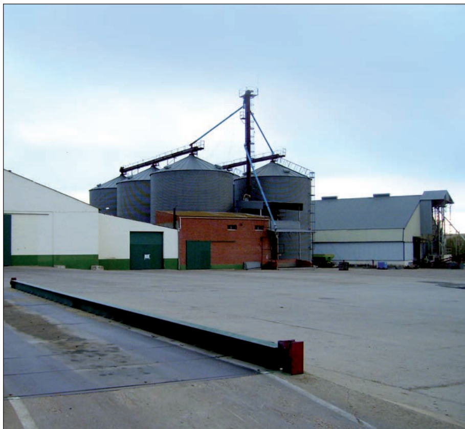
La economía social registra una facturación de 145.299 millones de euros.

c) Promoción de la solidaridad interna y con la sociedad que favorezca el compromiso con el desarrollo local, la igualdad de oportunidades, la cohesión social, la inserción de personas en riesgo de exclusión social, la generación de