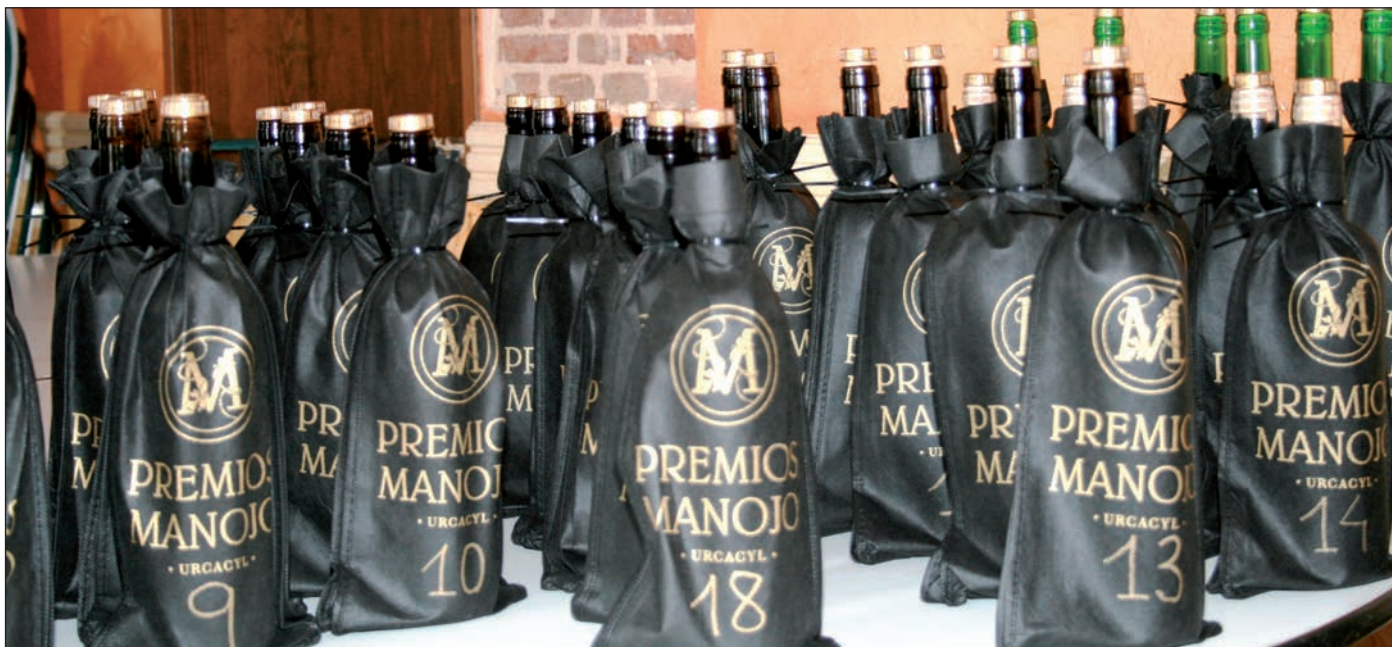
Vinos ensacados, precintados y numerados, dispuestos para las catas.

El certamen de bodegas cooperativas con más prestigio de España