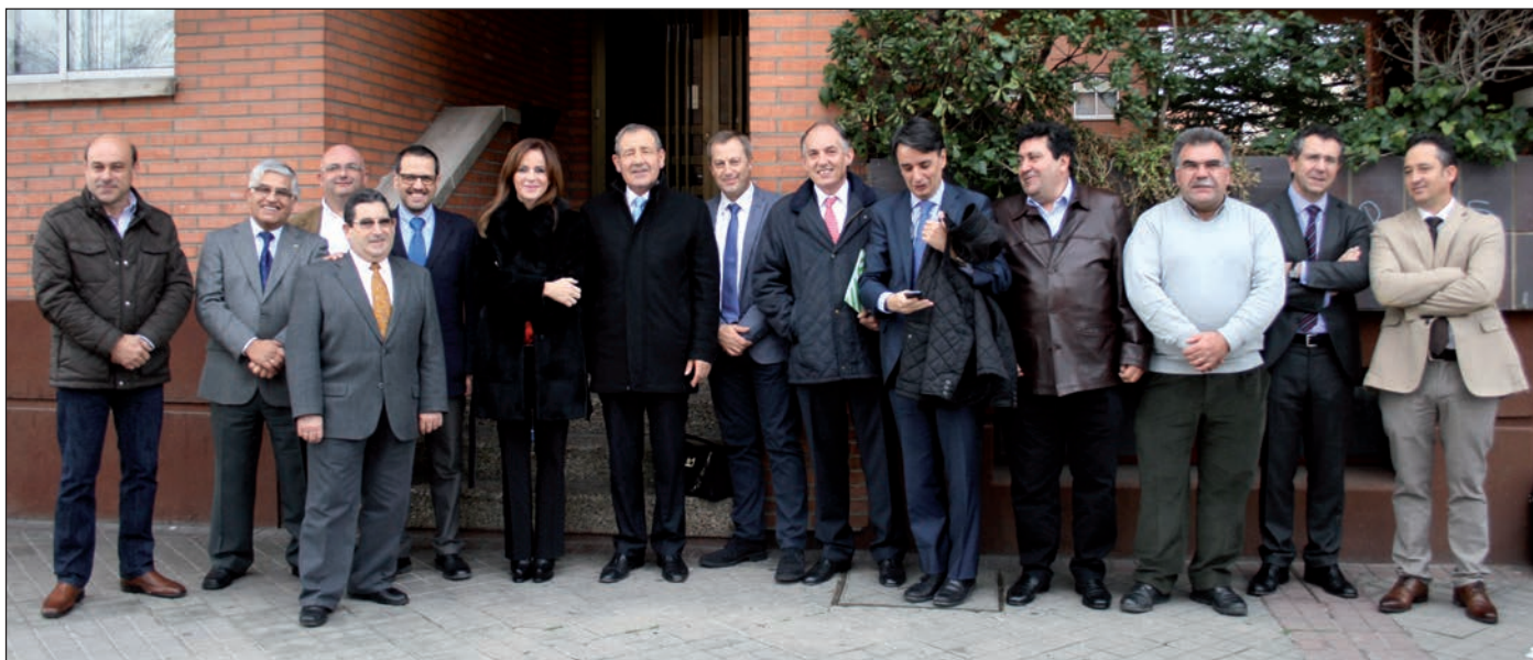
Consejo Rector de Urcacyl con Silvia Clemente, consejera de Agricultura y Ganadería, tras la presentación del Plan de Acción del Cooperativismo de Castilla y León.

Contempla la figura de Entidades Asociativas Agroalimentarias Prioritarias de carácter regional