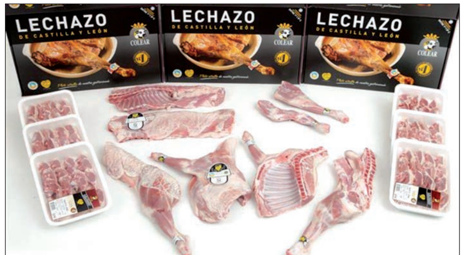
Colear centra sus ventas en el mercado nacional, principalmente en grandes superficies y canal Horeca.

Desde Colear insisten que se trata de una iniciativa abierta a todo el sector del ovino y hacen un llamamiento