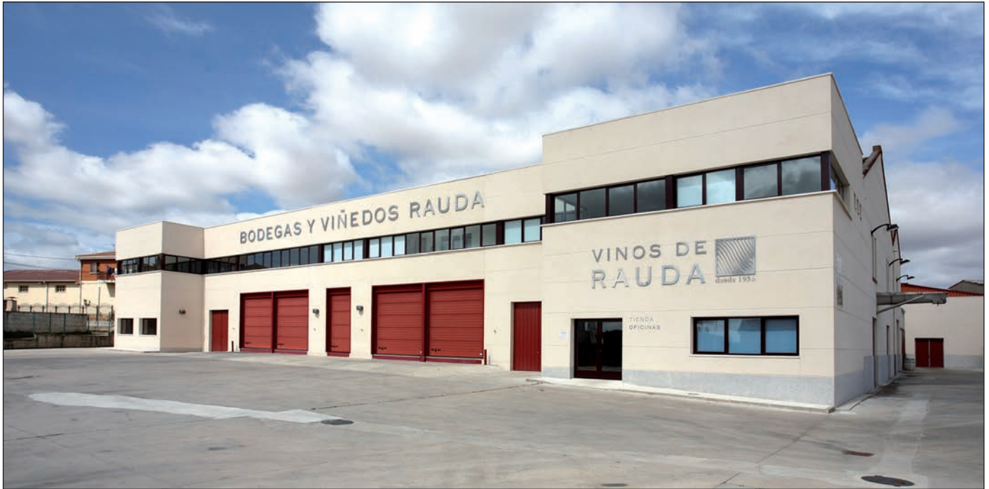
Bodega y Viñedos Rauda se ubica en Roa (Burgos).