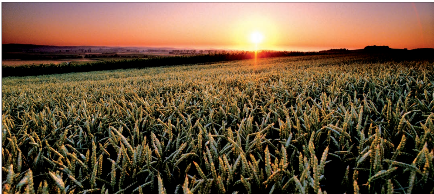
Urcacyl cree que la reforma de la PAC traerá cambios, pero más en la forma que en el fondo.

gencia, sin más, resolverá algunas situaciones injustas, generando posiblemente otras en el futuro.