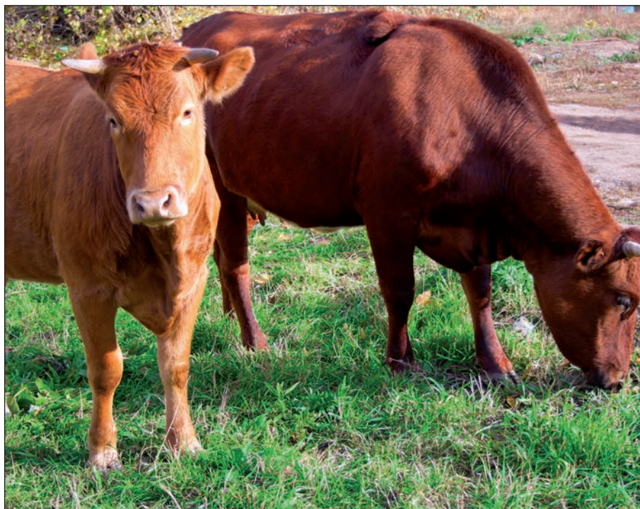
Las cooperativas de carne de vacuno piden que se tengan en cuenta las marcas de calidad.

El criterio fundamental bajo el punto de vista cooperativo es que los titulares de las explotaciones estén agrupados en entidades democráticas y económicas, como lo son las Organizaciones de Productores, las Agrupaciones de Productores o cualesquiera otras que se definan en el sector, y cuyo último fin sea el equilibrio de la cadena de valor agroalimentaria. Como en todos los sectores es necesario aumentar la concentración de la oferta