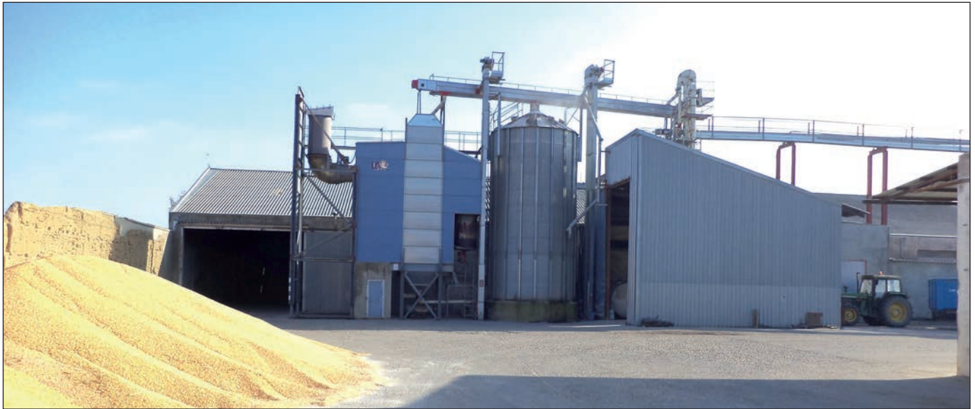
Instalaciones de Arión, cuya sede se ubica en Casasola de Arión (Valladolid).

La cooperativa vallisoletana estudia implantar un punto Sigfito y envasar aceite de girasol