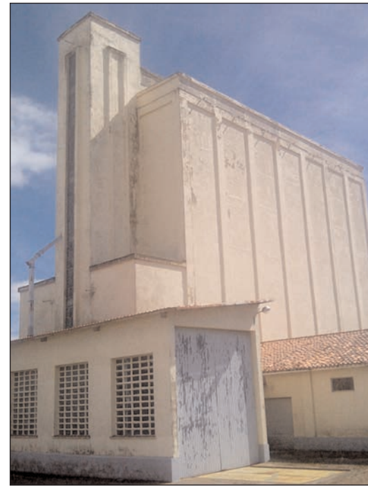
Silo de la red secundaria de almacenamiento.

Debido a la sentencia existente no se puede proceder a prorrogar la concesión. No obstante, en la Consejería de