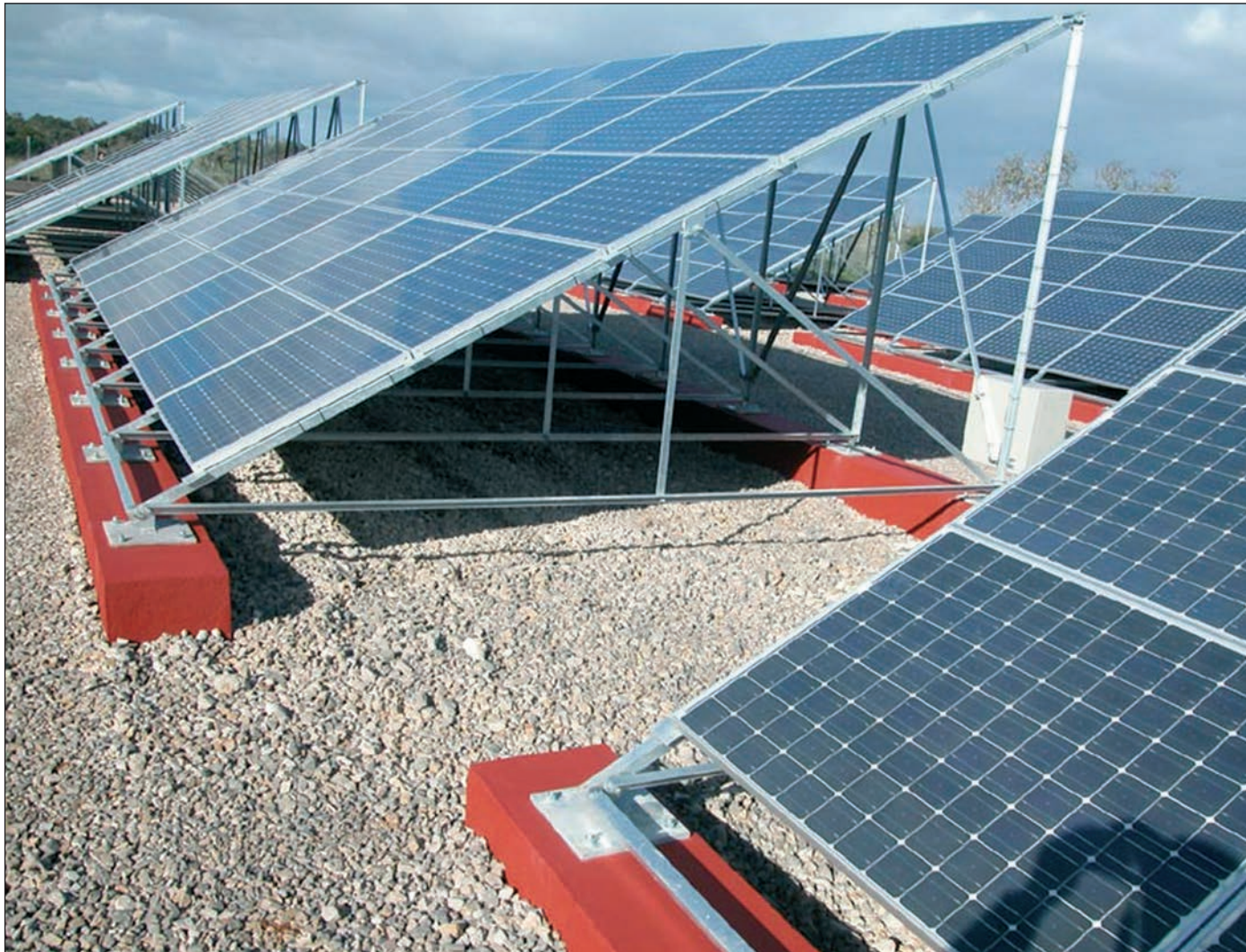
Las energías renovables son muy importante en el ámbito agrario.

Por último, cabe reseñar la importancia de las tecnologías renovables en el ámbito agrario. La generación de energía distribuida hace que se produzca más cerca del punto de consumo (al que muchas veces no llegan las infraestructuras y el suministro convencional), eliminando costes de distribución y elevadas inversiones. Esto es especialmente importante en un sector tan disperso geográficamente como el agrario y es algo que se ha entendido adecuadamente en otros países como Italia, Dinamarca, EE UU o Japón, donde se aplica el sistema de balance neto (el agricultor o industria produce energía, que consume en todo o en parte en su actividad, volcando a la red el sobrante y demandan-