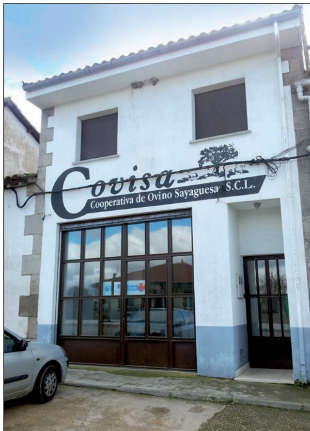
Covisa tiene su sede en Zamora y centro de dispensación de productos zoonosanitarios en Bermillo de Sayago.