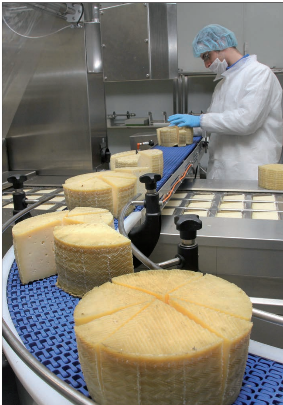
Las cooperativas Coacome, Latarce, Coccocea, Coval, Agroduero y San Isidro se han integrado en el Grupo Alimentario Agropal.

Asimismo, explica que se trata de un modelo basado en la igualdad de derechos y obligaciones de todos los socios. “Una cooperativa tiene que ser justa y dar a todos el mismo trato, el mismo precio. No es ético que haya precios diferentes para unos socios y para otros. Eso lo pueden hacer los comerciantes privados, pero una cooperativa no puede beneficiar a unos perjudicando a otros” , afirma Reales.