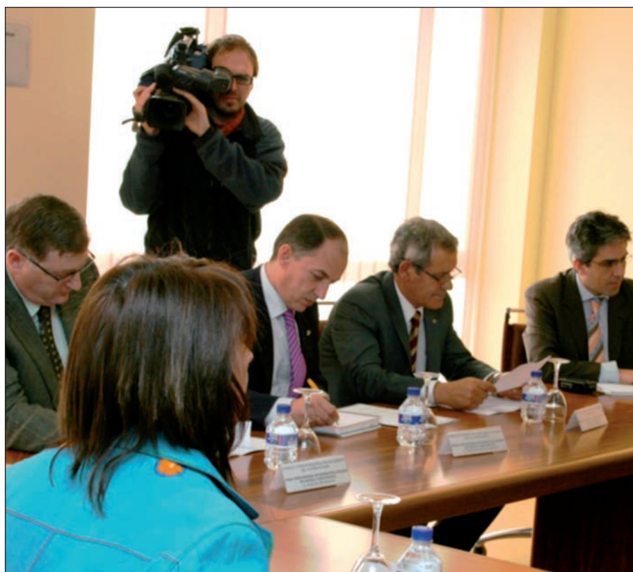
Representantes de Urcacyl en una de las sesiones del Consejo Superior del Cooperativismo.

-El Consejo regional de Economía social de Castilla y León, en el que están representadas las cooperativas junto con las sociedades anónimas laborales, los centros especiales de empleo y las empresas de inserción. Este Consejo fue creado por Decreto 11/2009, de 29 de enero, siendo el órgano colegiado asesor y consultivo de la Administración de la Comunidad de Castilla y León, para la promoción y difusión de la Economía Social.