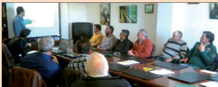
Grupos de trabajo para revisar los planes estratégicos de Copasa (arriba) y de Bodega Cuatro Rayas (abajo).