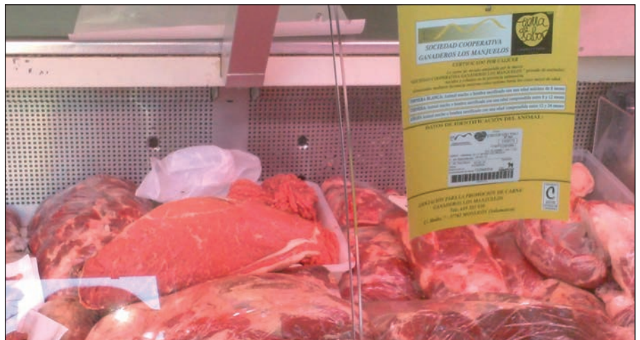
El Manjuelo alcanzó una facturación de dos millones de euros en 2013.

“Trabajamos para obtener mayor rentabilidad en la producción de nuestros ganaderos, mejorar el precio de compra de los suministros, como pienso, paja y gasóleo, entre otros, y conseguir carne de alta calidad” , subraya el presidente de esta cooperativa salmantina, que en 2013 facturó dos millones de euros. Sus pre-