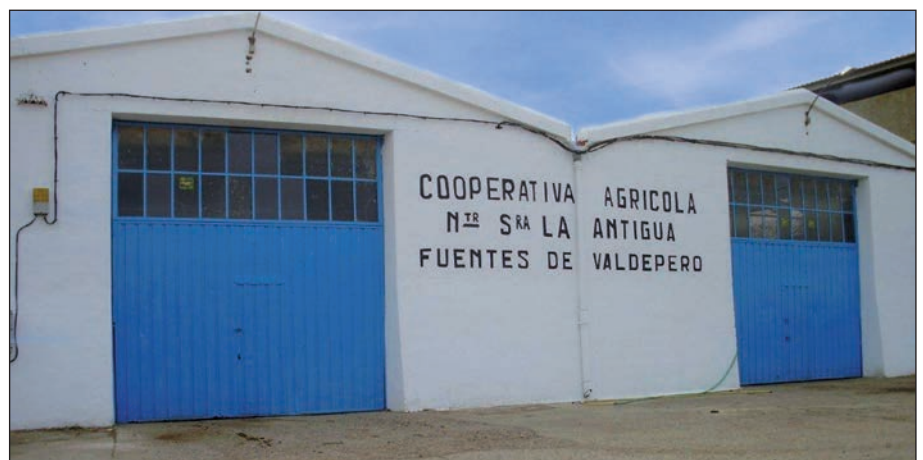
Nuestra Señora La Antigua cumplió medio siglo de historia en junio de 2013.