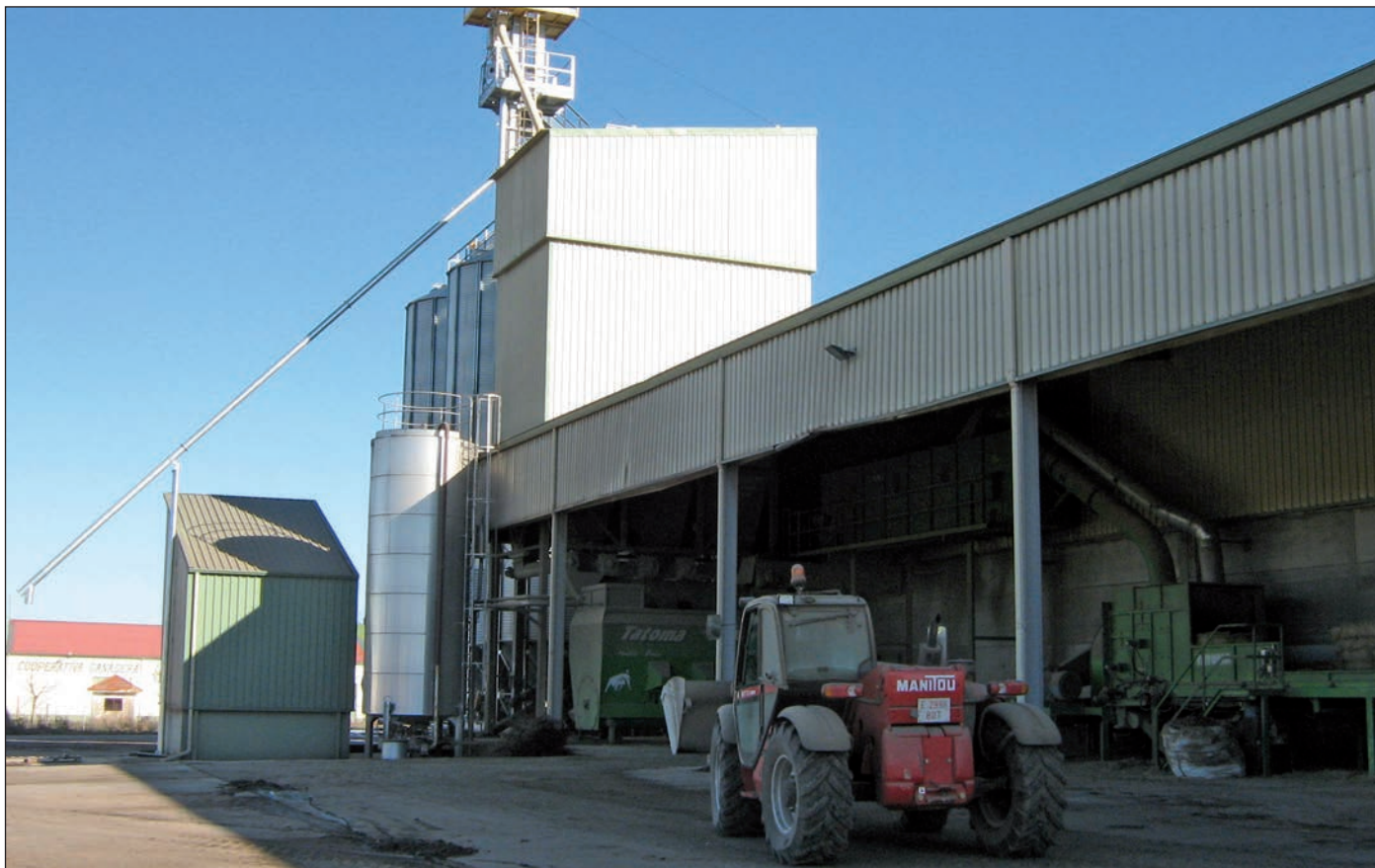
La inclusión de las Entidades Asociativas Prioritarias de carácter regional en este plan fue solicitado por Urcacyl.

da; dimensionamiento adecuado y flexible de las cooperativas para aprovechar sinergias; cambio cultural imprescindible para una mayor profesionalización, e imagen y comunicación para incrementar la visibilidad del sector.