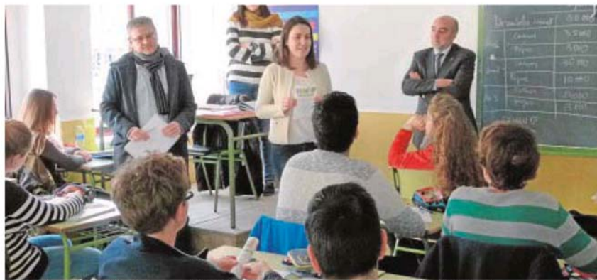
El alcalde de la localidad y la concejal de Juventud presentaron esta iniciativa en el IES «Sotomayor»