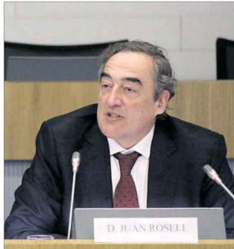
El presidente de CEOE, Juan Rosell.

En concreto, desde CEOE calculan que si el PIB creciera un 2,5% y los salarios se incrementaran el 1,5% que piden los sindicatos, los costes laborales unitarios