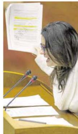
Mónica Oltra ayer en las Cortes

La portavoz adjunta de Compromís, Mónica Oltra, también abogó por un