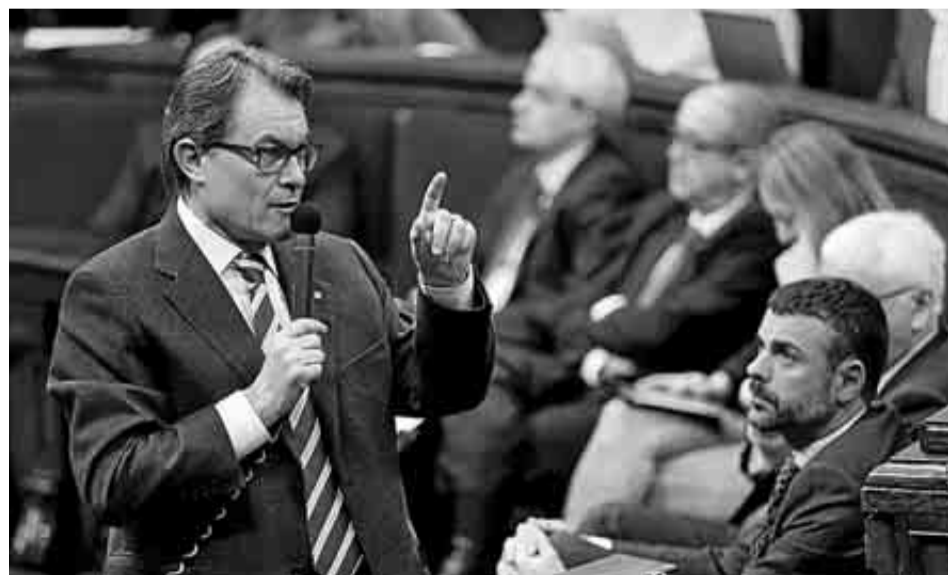
El presidente de la Generalitat, Artur Mas, ayer en la sesión de control del Parlament.

Catalunya es la única comunidad autónoma que no dispone de una ley electoral propia, por lo que sigue amparándose en la legislación y la autoridad estatal creada