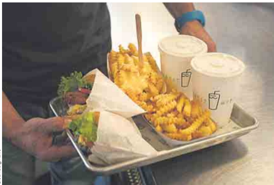
Lo típico en Shake Shack es pedir una mezcla original: una hamburguesa con patatas y un batido.

Cambio de tendencia Así lo aseguran los expertos que analizan el debut en Bolsa de Shake Shack, que saltó al parque el pasado viernes con una revalorización de más del