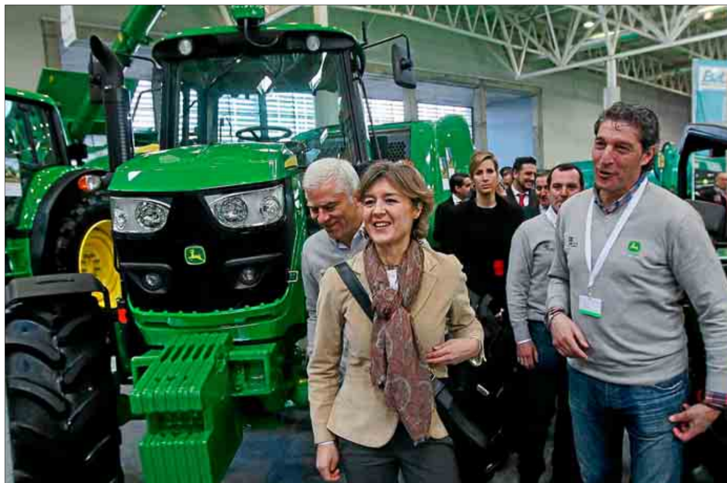
La ministra de Agricultura, Alimentación y Medio Ambiente, Isabel García Tejerina, visita el expositor de John Deere.

La campaña de remolacha en Castilla y León ha presentado unos rendimientos record en este ejercicio. Los 4.112 cultivadores han incrementado la superficie sembrada en más de 3.000 hectáreas hasta alcanzar las 26.000 en la comunidad autónoma.