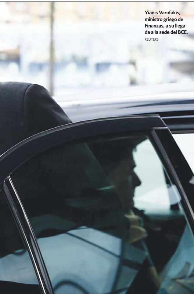
Yianis Varufakis, ministro griego de Finanzas, a su llegada a la sede del BCE.

Aunque no se trata (de momento) de peticiones oficiales, Atenas ya ha rechazado estas posiciones en su totalidad, sosteniendo que, sin embargo, muestran que el Gobierno alemán está de facto en la mesa de la negociación. La respuesta de la capital griega es que dichas posiciones vienen en contra de la opinión recientemente expresada por el pueblo griego y no contribuyen hacia una perspectiva europea de desarrollo. Las posiciones, pues, se mantienen enrocadas.