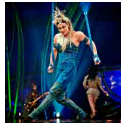
Amaluna de Cirque du Soleil.

El 6 de mayo se estrena en Madrid Amaluna de Cirque du Soleil. La compañía, que ha elegido España para el estreno europeo de su última producción en gira, rinde un homenaje a la mujer en este nuevo espectáculo.