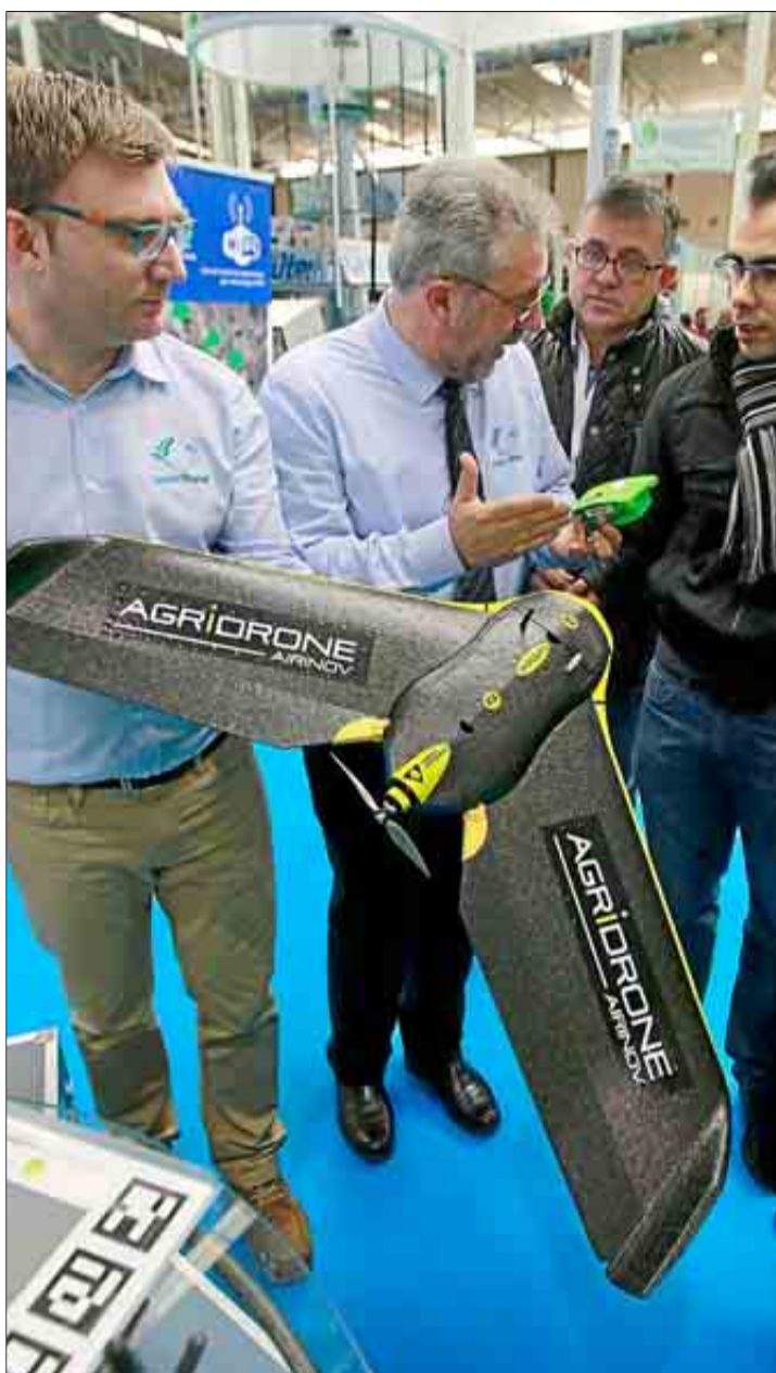
Unos visitantes se interesan por el dron de la empresa SmartRural.

Desde vehículos punteros hasta piezas de repuestos, el abanico de productos es amplísimo. Una oferta única para una Comunidad de altura.