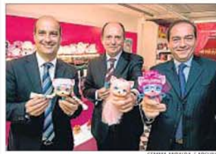
Equipo directivo de IMC Toys