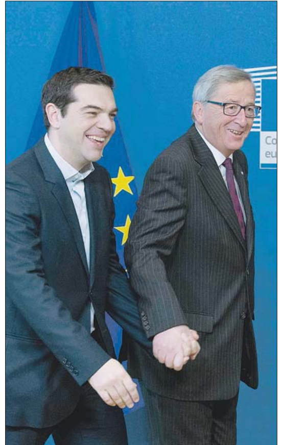
El primer ministro griego junto al presidente de la Comisión Europea.

La respuesta del presidente del Consejo Europeo, Donald Tusk, fue mucho más cauta. Con la mirada en Alemania, el responsable del club de los líderes europeos avisó que se necesita "una solución aceptable para todos los Estados involucrados", que recordó que pi-